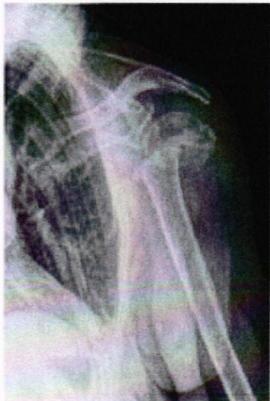
RX scomposizione secondaria