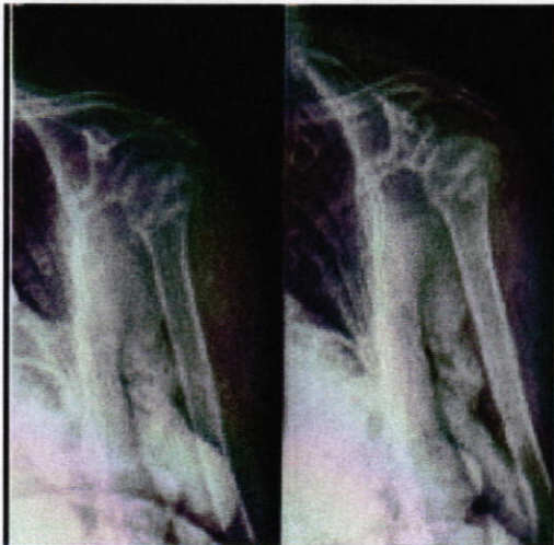
RX al momento del trauma

Handwritten signatures and a circular stamp from Azienda Sanitaria Locale 70141.